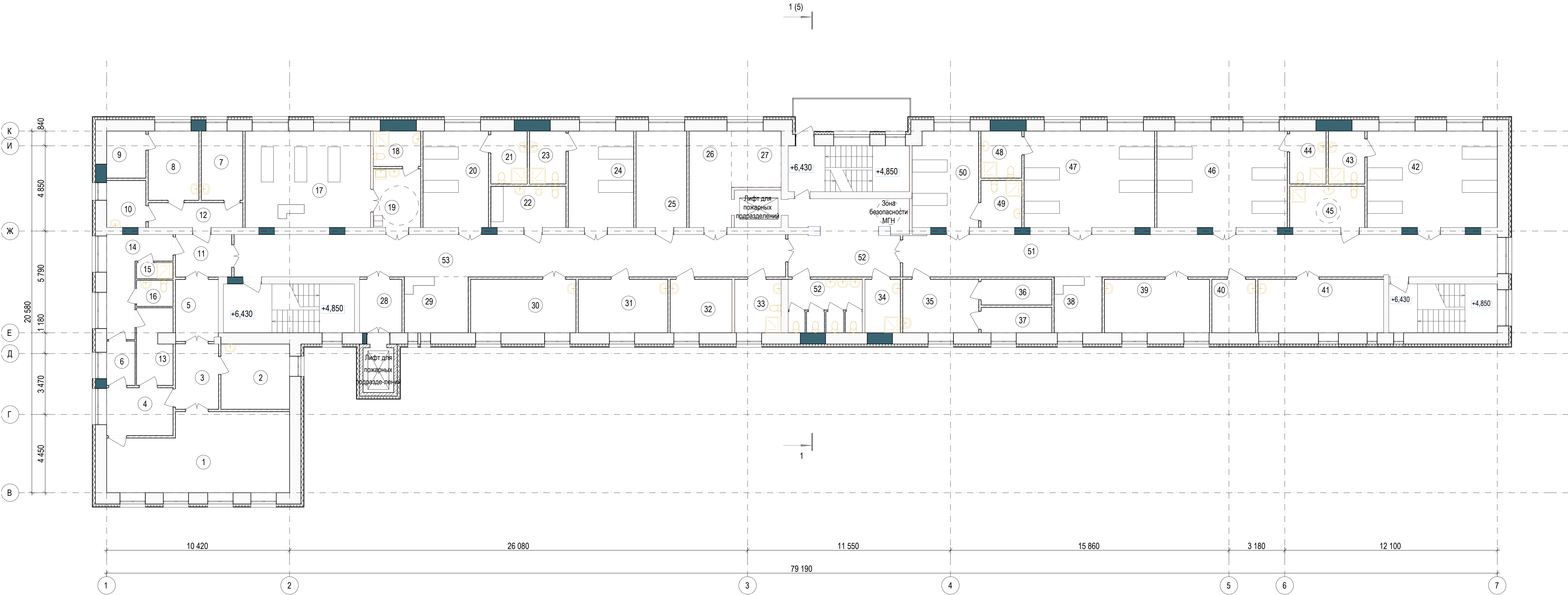
Экспликация помещений на отм.+6,430