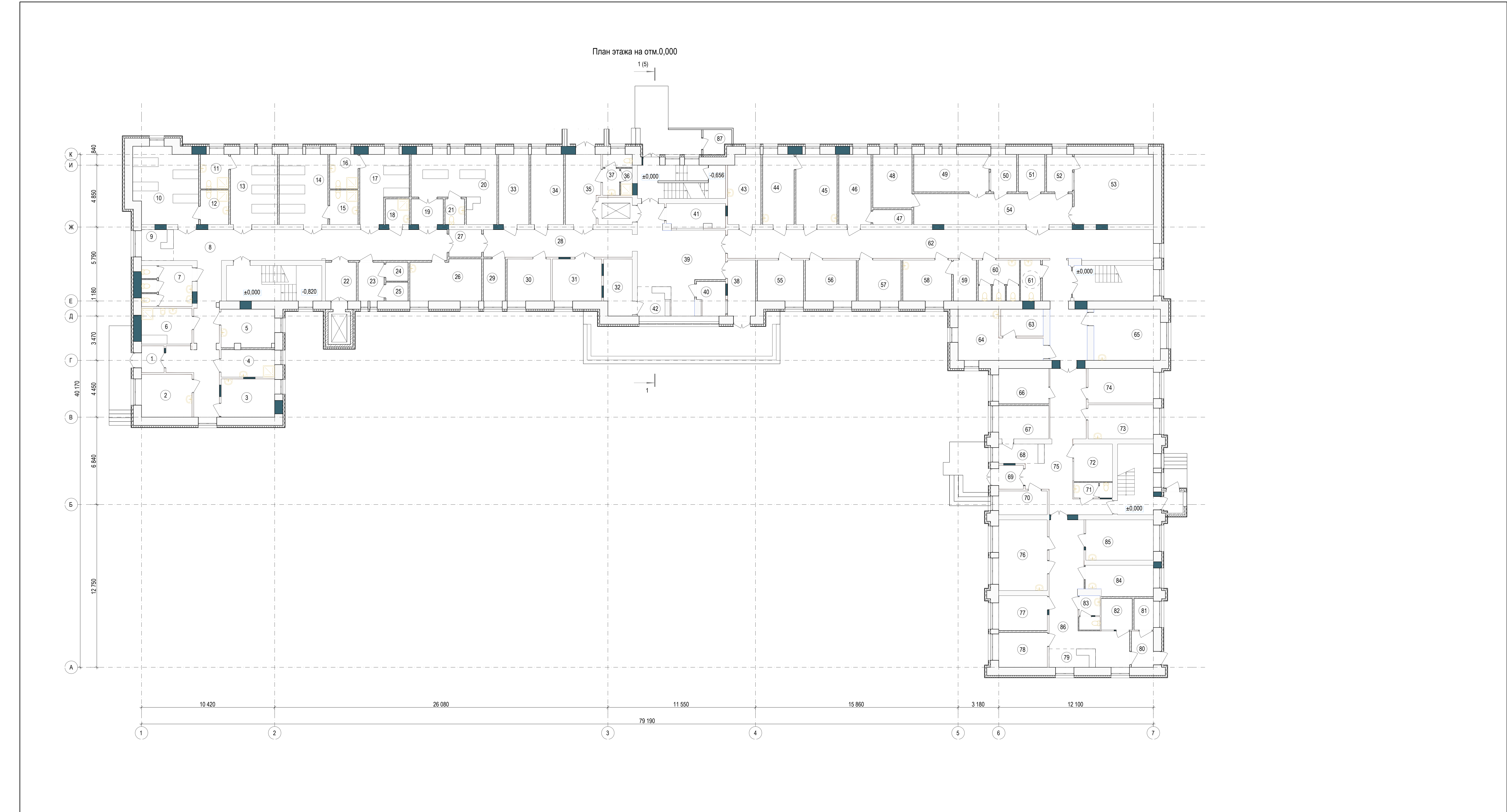
Экспликация помещений на отм.0,000